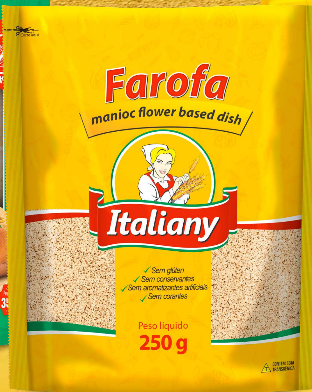
Farofa (manioc flower based dish) 250 g