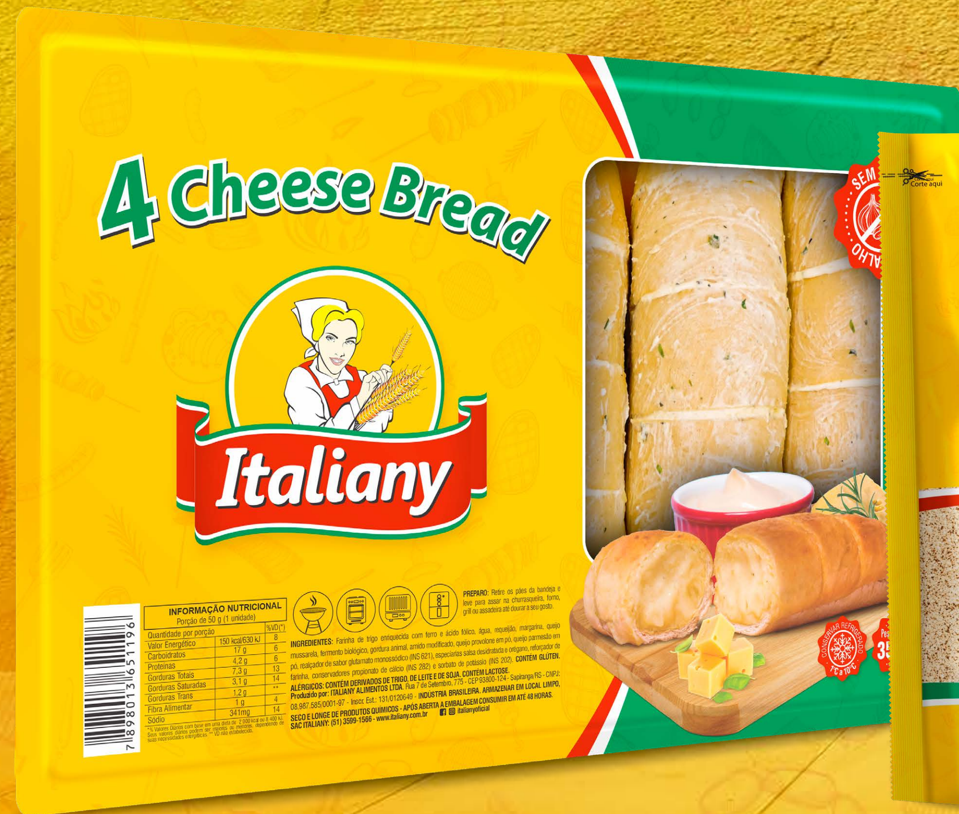
Four Cheese Bread 350 g